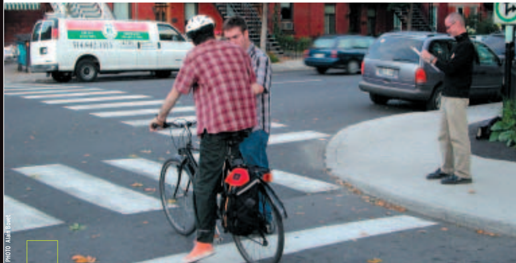
Séance de recensement de cyclistes à Montréal.

Chaque étude de L'état du vélo — celle de 2005 ne faisant pas exception — fait ressortir l'importance de disposer de paramètres les plus uniformes possibles d'un endroit à l'autre, afin de mieux évaluer l'achalandage sur la Route verte et sur l'ensemble du réseau cyclable québécois. Vélo Québec Association vient d'initier une démarche en ce sens, en collaboration avec l'Association des Réseaux cyclables du Québec (ARCQ) et le ministère des Transports du Québec (MTQ). Dans un premier temps, le groupe de travail