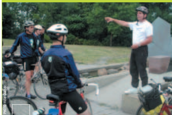
Le séjour technique : formule originale pour découvrir la Route verte sur le terrain.

www.routeverte.com ou 1 800 567-8356, poste 309.