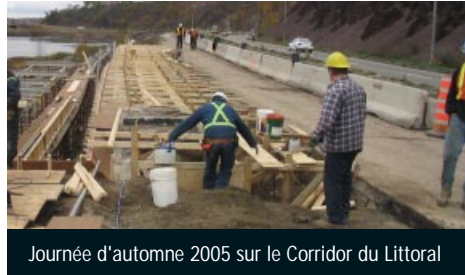
Journée d'automne 2005 sur le Corridor du Littoral

La Commission de la capitale nationale du Québec (CCNQ) met les bouchées doubles pour s'assurer que les travaux en bordure du fleuve, sur la piste du Corridor du Littoral, soient complétés pour le 23 juin prochain. Au cours de l'automne, des équipes ont entamé des travaux importants sur la portion située entre la côte de l'Église (dans le secteur de Sillery) jusqu'à la gare maritime de Québec, à l'est de la côte Gilmour. En incluant les études préalables, honoraires, travaux d'ingénierie et travaux sur le terrain, la CCNQ et la Ville de Québec auront investi plus de 5 millions de dollars pour compléter ce tronçon de 3 kilomètres. Des travaux en marge de la voie ferrée sont également prévus plus à l'ouest, entre l'avenue des Hôtels et le sommet de la côte Ross en 2007. Enfin, le projet de la promenade Samuel-De Champlain, prévue pour les fêtes du 400 e de Québec en 2008, permettra de compléter la Route verte en bordure du fleuve, sur le territoire de la Ville de Québec. Selon Marc Bertrand , chargé de projet à la CCNQ, « on peut déjà s'attendre à des équipements cyclables de qualité dès cette année, qui permettront aux cyclistes de parcourir les berges du fleuve du Vieux-Port de Québec jusqu'au secteur de Sillery et, de là, rejoindre le chemin Saint-Louis ».